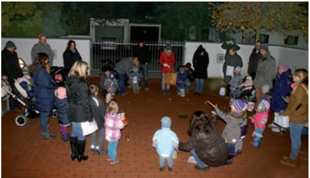
St. Martin-Laternenumzug der Spielgruppe am 9. November.

Für die Lesungen zwischen den Musikwerken konnte Kirchenmusikdirektor Reinhold Meiser, Ingolstadt gewonnen werden. Einlass ist ab 18.30 Uhr. Bei freiem Eintritt werden Spenden für die Kirchenmusik erbeten.