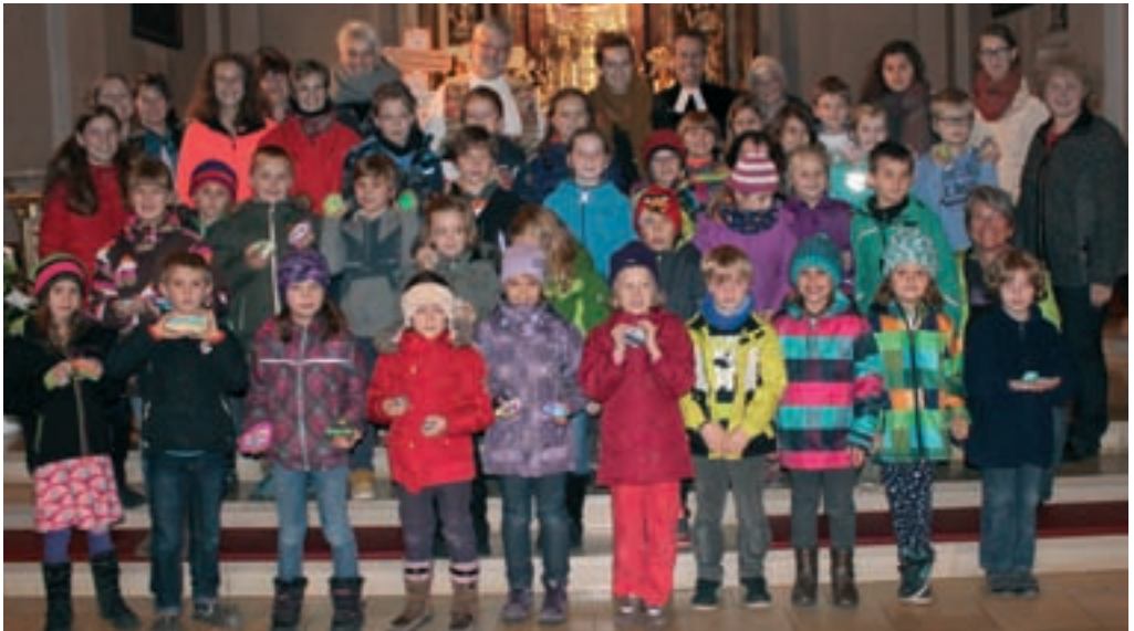
Am Samstag, 15. November fand in Buxheim der ökumenische Kinderbibeltag statt. Die Kinder lernten das 8. Gebot kennen.