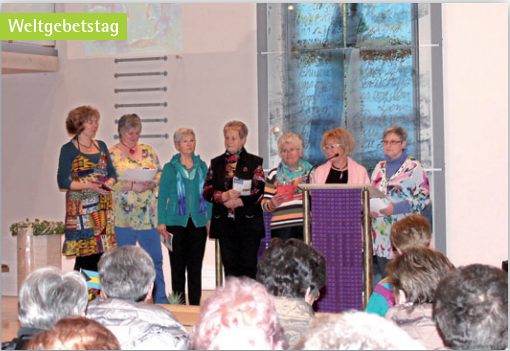
Weltgebetstagsgottesdienst in unserer Friedenskirche am 6. März.