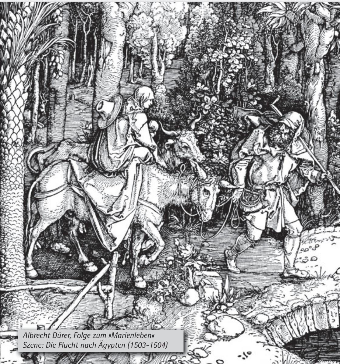
Albrecht Dürer, Folge zum »Marienleben« Szene: Die Flucht nach Ägypten (1503-1504)