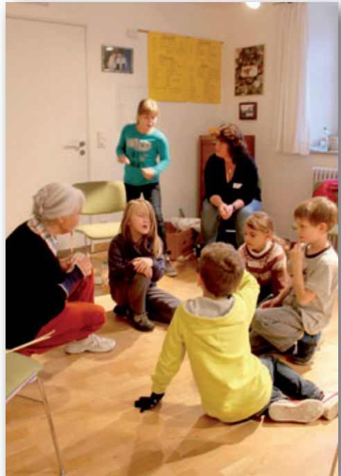
Ökumenischer Kinderbibeltag in Buxheim am 14. November

Unser Frauenkreis hat Marmeladen, Stricksocken, Plätzchen und Adventskränze verkauft und damit EUR 1.000,- eingenommen! Dieser Erlös wird je zur Hälfte an die Straßenambulanz Ingolstadt und an die Kirchengemeinde Kilakala/Tansania weitergeleitet. Ein großer Dank dem Frauenkreis und der gesamten „Kundschaft“!