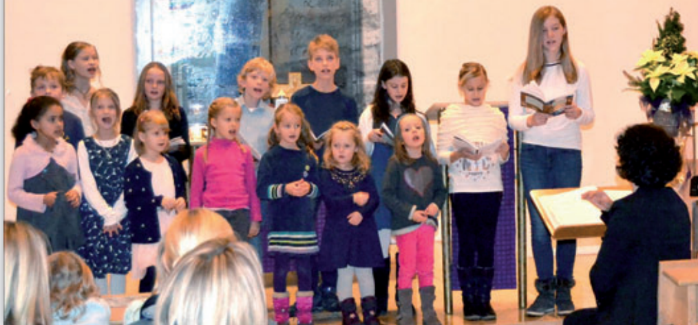
Kinderadventssingen am 29. November