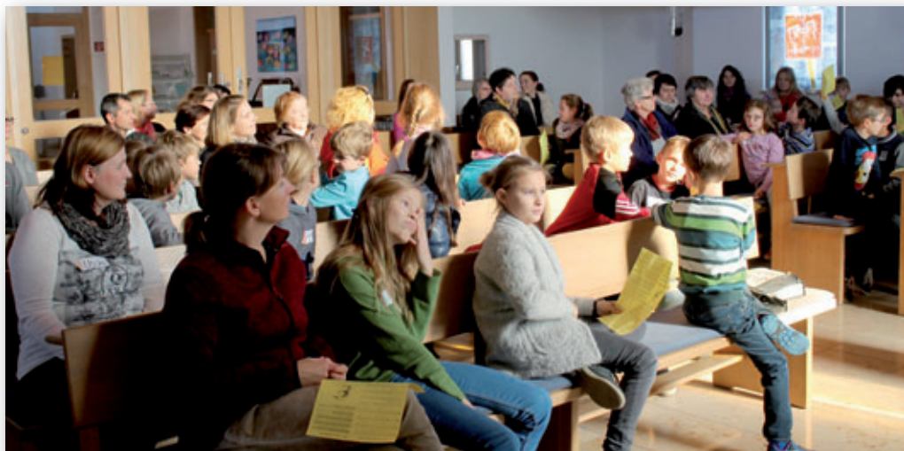
Kinderbibeltag in Gaimersheim am 18. November