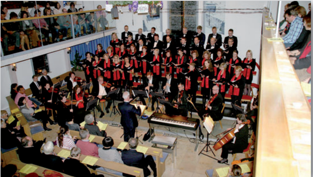
Weihnachtskonzert der Gaimersheimer Kantorei am 6. Dezember

Am Sonntag, 21. Februar um 10 Uhr, laden wir besonders diejenigen zur Tauferinnerung ein, die im vergangenen Jahr durch die Taufe ganz offiziell zu Kindern Gottes und Mitgliedern der weltweiten Kirche geworden sind. Aber auch die drei Konfirmandengruppen und die ganze Gemeinde sind herzlich eingeladen. Im Anschluss an den Gottesdienst wird es ein einfaches Gemeindeessen geben.