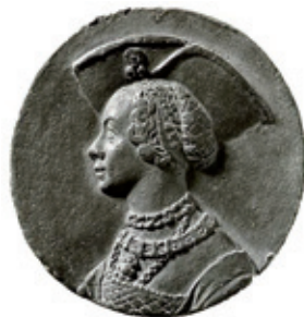
Argula von Grumbach

Anders als in Ingolstadt, wo sich erst Ende des 18. Jahrhunderts Evangelische ansiedeln konnten, war es in Neuburg/Donau. Pfalzgraf Ottheinrich führte 1542 mit dem Theologen Andreas Osiander aus Nürnberg die Reformation in seinem Gebiet ein. Auch wenn zwischen 1546 und 1552 der protestantische Einfluss zurückgedrängt wurde, war im Fürstentum Pfalz-Neuburg die Reformation bis 1614 die vorherrschende Konfession – also zwischen Lauingen bis südlich von Ingolstadt und in einigen Gebieten Nordbayerns. Übrigens: die Schlosskapelle von Neuburg war weltweit eine der ersten Kirchen, die protestantisch fertiggestellt wurde!