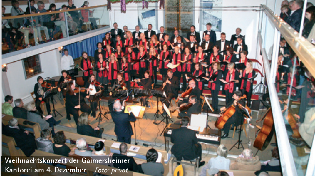
Weihnachtskonzert der Gaimersheimer Kantorei am 4. Dezember