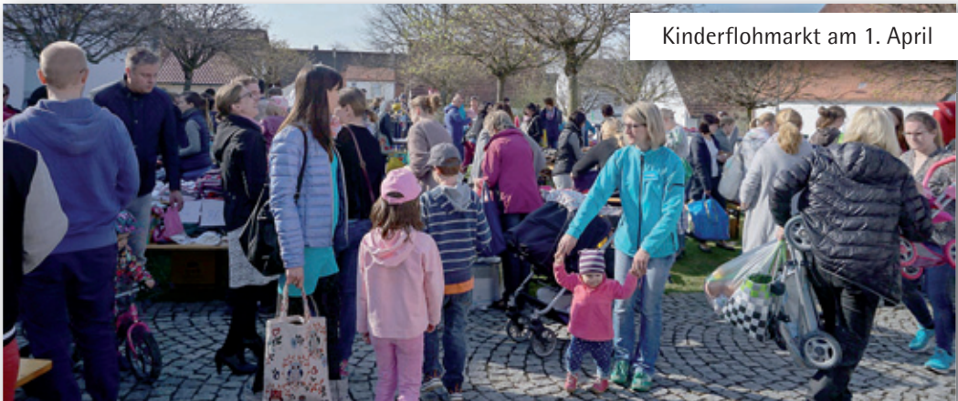
Kinderflohmarkt am 1. April