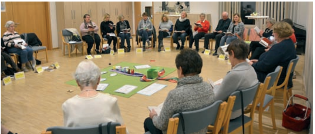
Am Kurs „Stufen des Lebens“ haben dieses Jahr 35 Personen teilgenommen.

Kirchenvorstand (öffentliche Sitzung): Mittwoch, 06.06., 20.00 Uhr