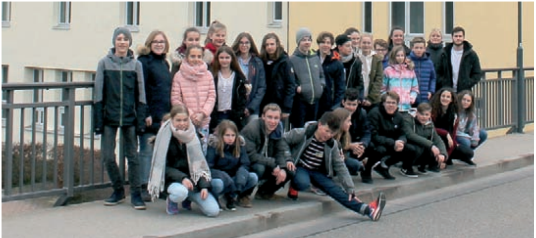
Präparanden-Rüstzeit in Gunzenhausen im März