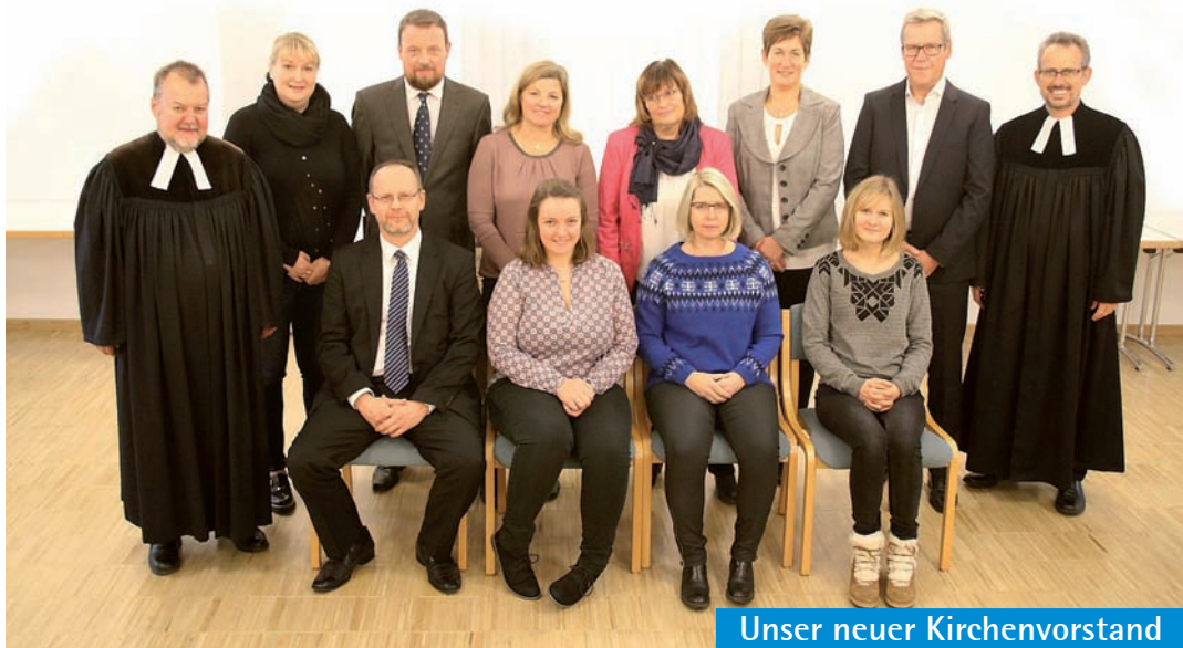
Unser neuer Kirchenvorstand

Im Frauenkreis am 20. Februar wird das Land Slowenien von Pfarrer Eckert vorgestellt. Wer aktiv einen Gottesdienst mitgestalten möchte, wende sich ans Pfarramt – wir vermitteln Ihr Interesse gern an das zuständige Team vor Ort weiter.