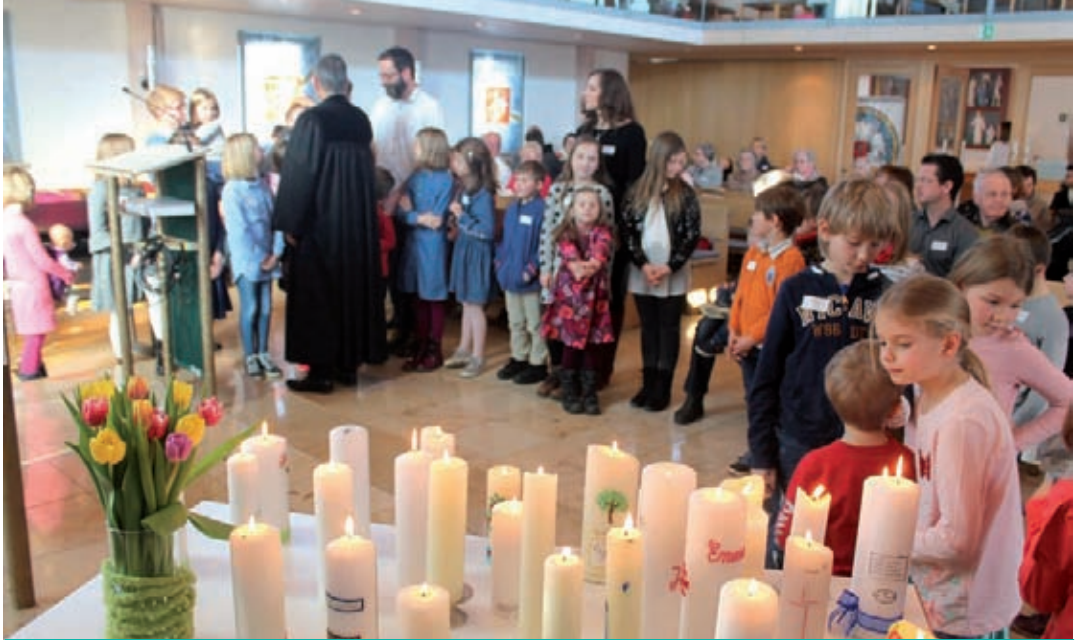
Tauferinnerungsgottesdienst mit Kinderchor am 17. Februar