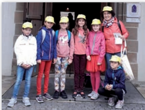
Unser Kinderchor am 13. Juli beim Landeskindertag in Gunzenhausen

Anmeldung bis 25.09. im Pfarramt erforderlich: Tel. 08458/331490 Email: pfarramt.gaimersheim@elkb.de