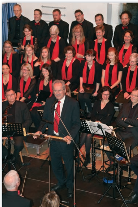
Weihnachtskonzert der Gaimersheimer Kantorei mit dem Münchner Alt-Oberbürgermeister Christian Ude

► Ökumenische Kinderkirche Böhmfeld: 16.02., 10.00 Uhr im katholischen Pfarrsaal