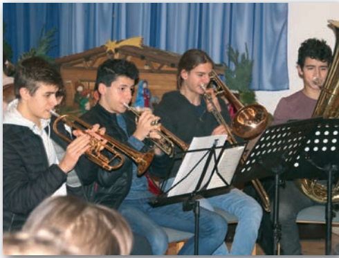
Kinderadventskonzert am 1. Dezember