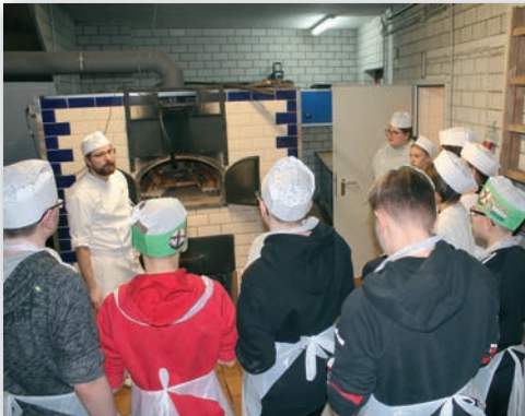
Einige unserer Konfirmandinnen und Konfirmanden bei der „Aktion 5000 Brote“