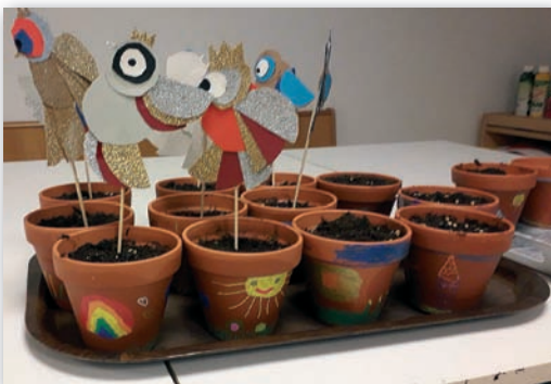
Kinderbibeltag Gaimersheim Mitte November zum biblischen Gleichnis vom Sämann