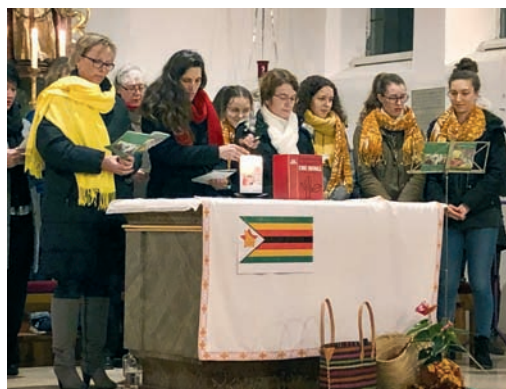
Ökumenischer Weltgebetstag in Tauberfeld am 6. März

Sprechzeiten in der Regel Donnerstag, 15–17 Uhr sowie nach telefonischer Vereinbarung