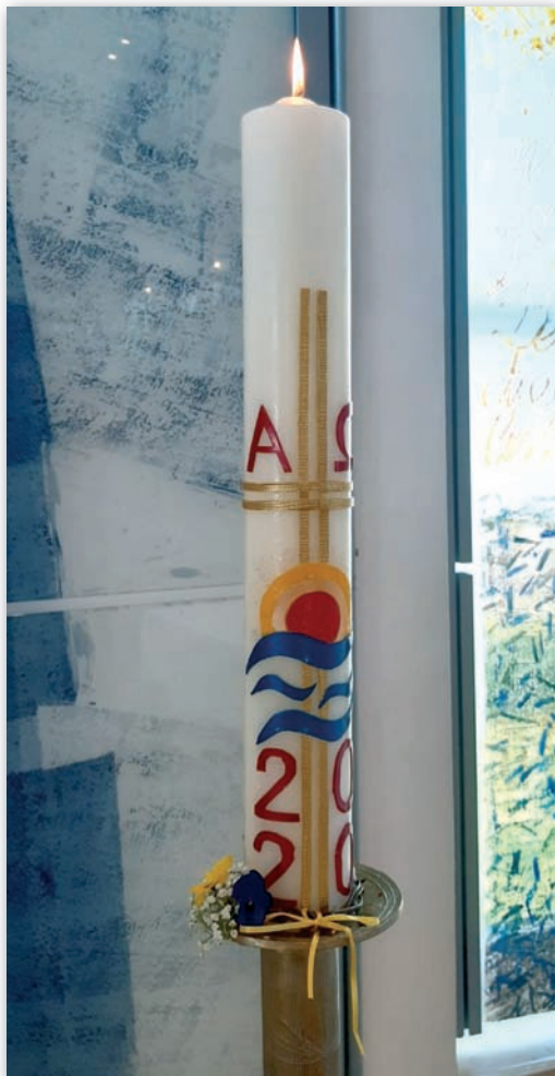
Unsere neue Osterkerze in Gaimersheim

In den nächsten Ausgaben des Gemeindebriefs kann hierzu hoffentlich – natürlich nach Rücksprache mit den direkt Verantwortlichen – Genaueres mitgeteilt werden.