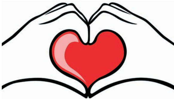
Ulrich Eckert, Pfarrer

Viel Freude an Gottes Gaben in diesem besonderen Sommer wünscht Ihnen und Euch