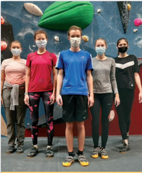
Kletteraktion der Jugendgruppe „Teens meet Jesus“ im Oktober