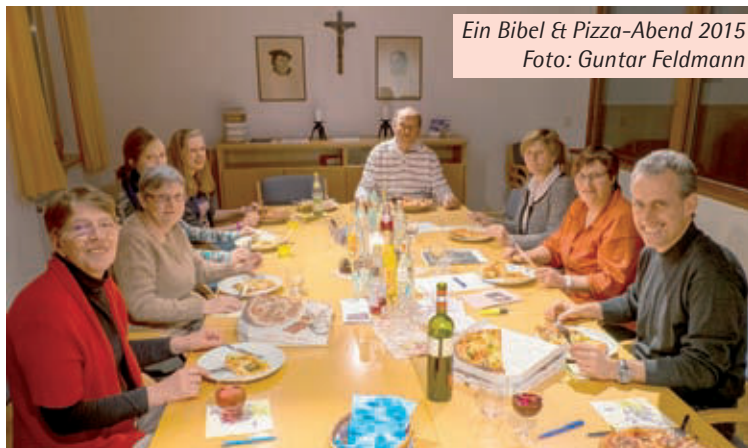
Ein Bibel & Pizza-Abend 2015

Nach der gemeinsamen abschließenden Mahl-