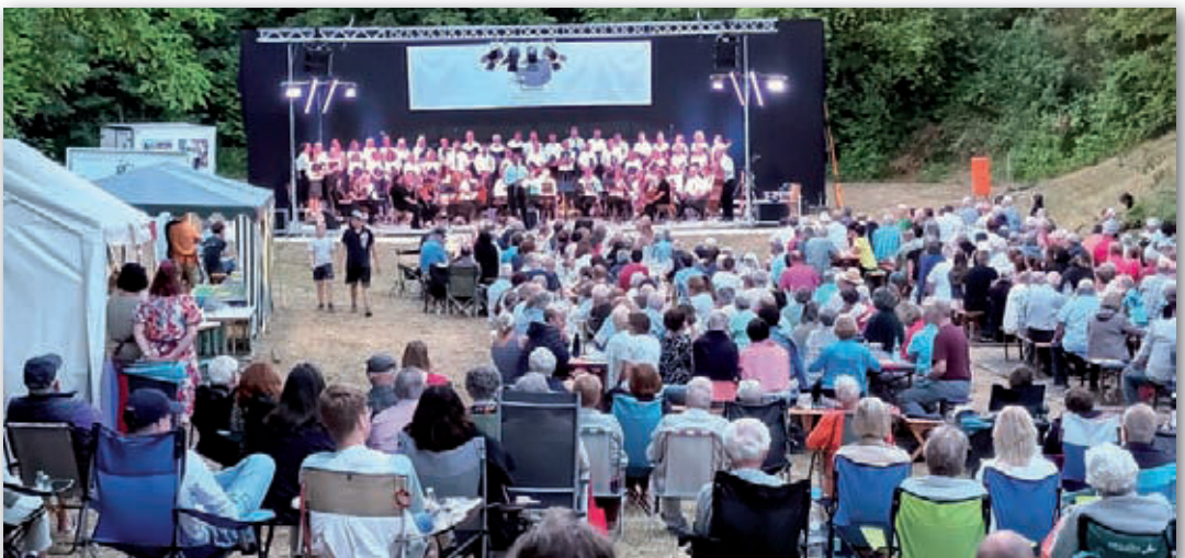
Serenade der Gaimersheimer Kantorei – Naturbühne im Fort am Kraiberg am 15. Juli