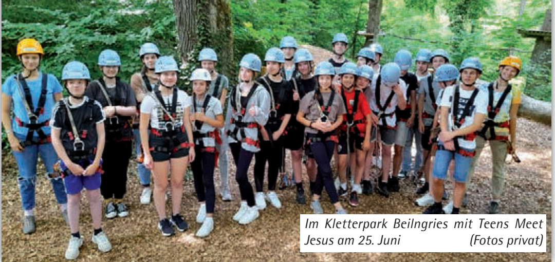
Im Kletterpark Beilngries mit Teens Meet Jesus am 25. Juni