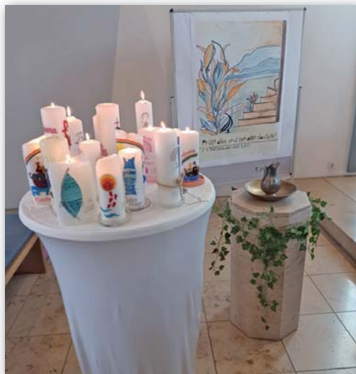
Tauferinnerungsgottesdienst am 16. März

Schon jetzt möchten wir darauf hinweisen, dass am Samstag, den 27. September in Gaimersheim ein großes Open-Air-Taufest geplant ist, zusammen mit unserer Nachbargemeinde Friedrichshofen. Nähere Infos gibt es bei Pfarrer Eckert.