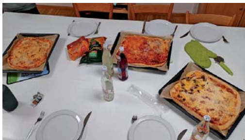
14. März: „Italienischer Abend“ des Offenen Jugendtreffs

Bei manchen gibt es nur noch wenige Plätze. Also schnell anmelden unter: https://www.ej-in.de/veranstaltungen/